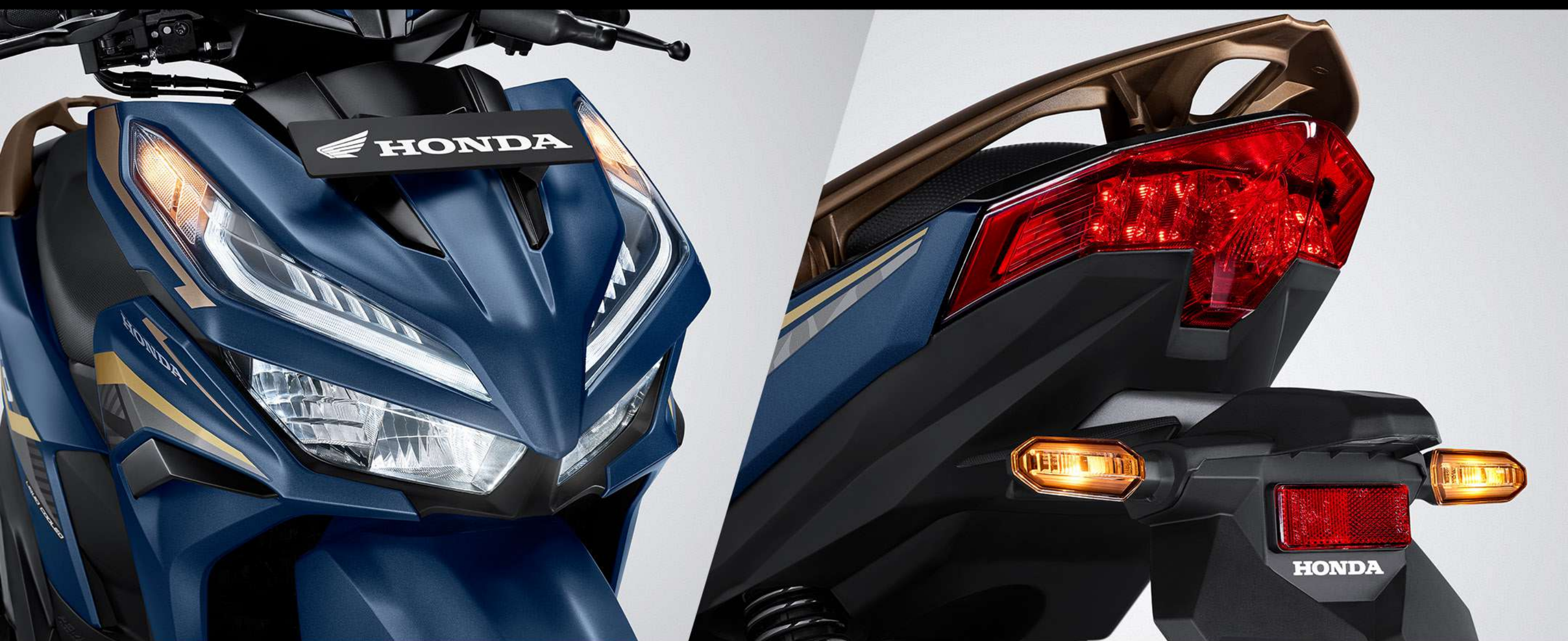
All LED Lighting System