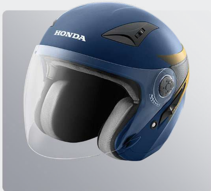
Honda Luxury Helmet