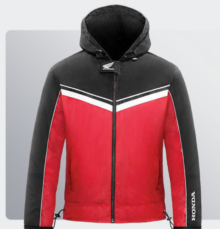
Honda Windbreaker Jacket