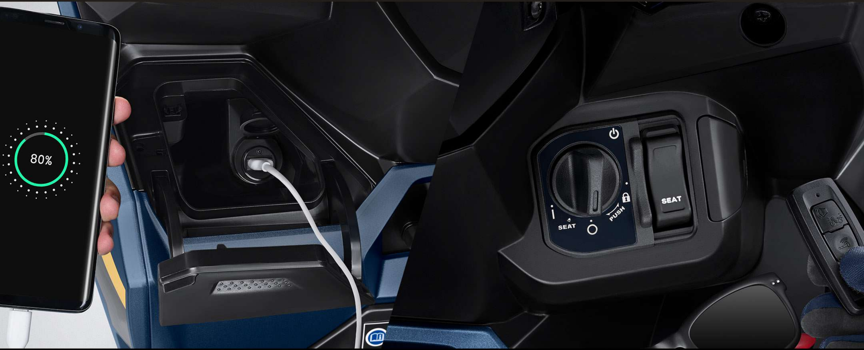
BARU USB Charger di Console Box