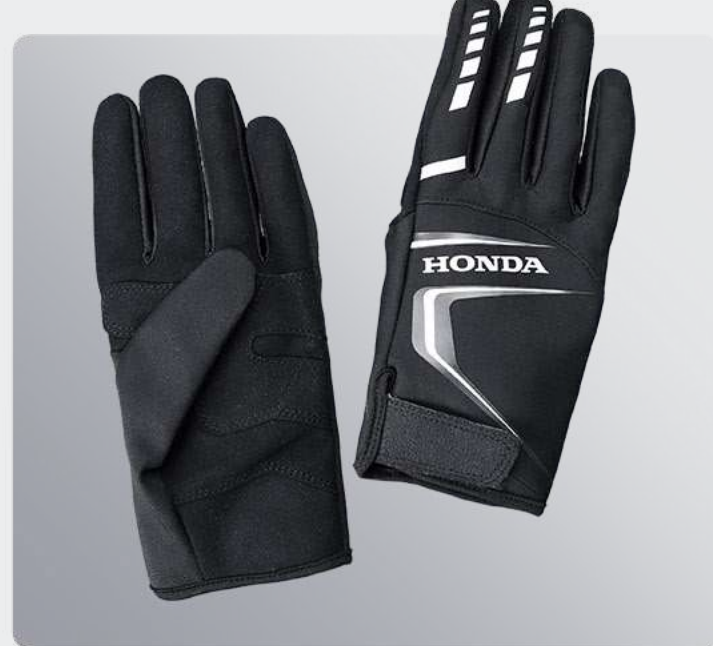
Honda Aquos Gloves