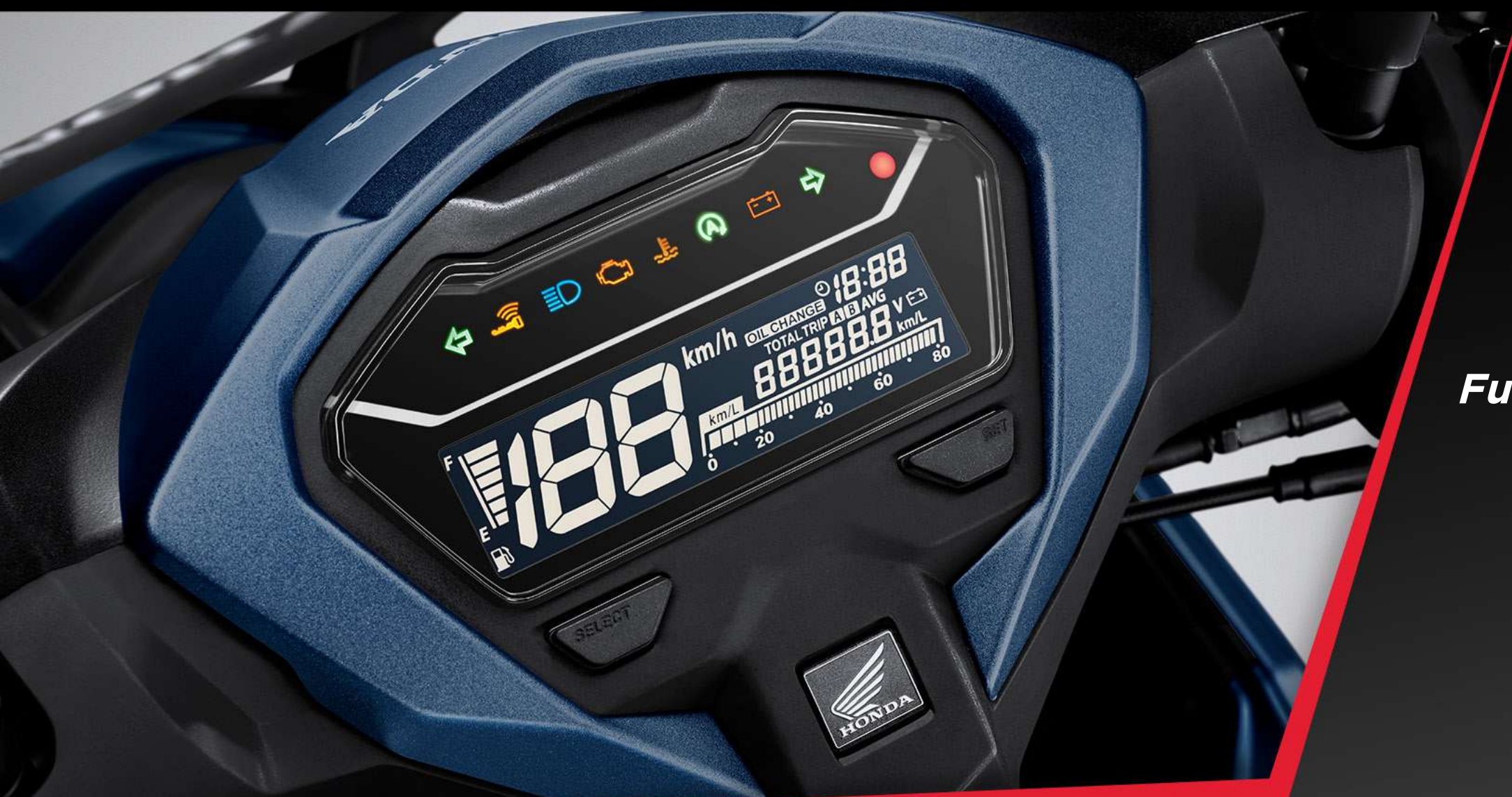
Full Digital Panel Meter